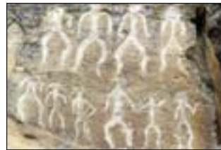
Gobustan, 10.000 jaar v. Ch

Oude cultussen (het animisme, voorouderverering, etc.) in Azerbeidzjan maken halverwege het eerste millennium voor Christus plaats voor het Zoroastrisme, een van de alleroudste religies. Het