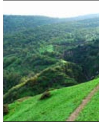
Lente in Azerbeidzjan

Het beroemde therapeutische Naftalan-koolwaterstof helpt bij verschillende ziekten. Het mineraalwater van de Istisu-bron in de Kelbejer-regio is een bekend bronwater. Het mineraalwater van de Badamly-, Sirab- en Vaikhyr-bron is zelfs ver buiten de regio populair.