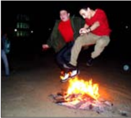
Novruz vuur ceremonie