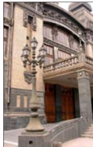
Opera Balet Theater in Bakoe

De componisten, waaronder Gara Garayev, Niyazi, Fikret Amirov en Arif Melikov, hebben grote invloed op de moderne muziek van Azerbeidzjan. Moderne jazzcomponisten die nationale thema's in hun werk verwerken, zijn succesvol en populair: Vagif Mustafazade,