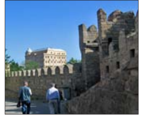
Oude Bakoe, hoofdstad van Azerbeidzjaan

als Pasen. De gerechten en zoetigheden die men dan eet, worden volgens eeuwenoude recepten klaargemaakt. Enkele hiervan zijn te vinden in dit kookboek.