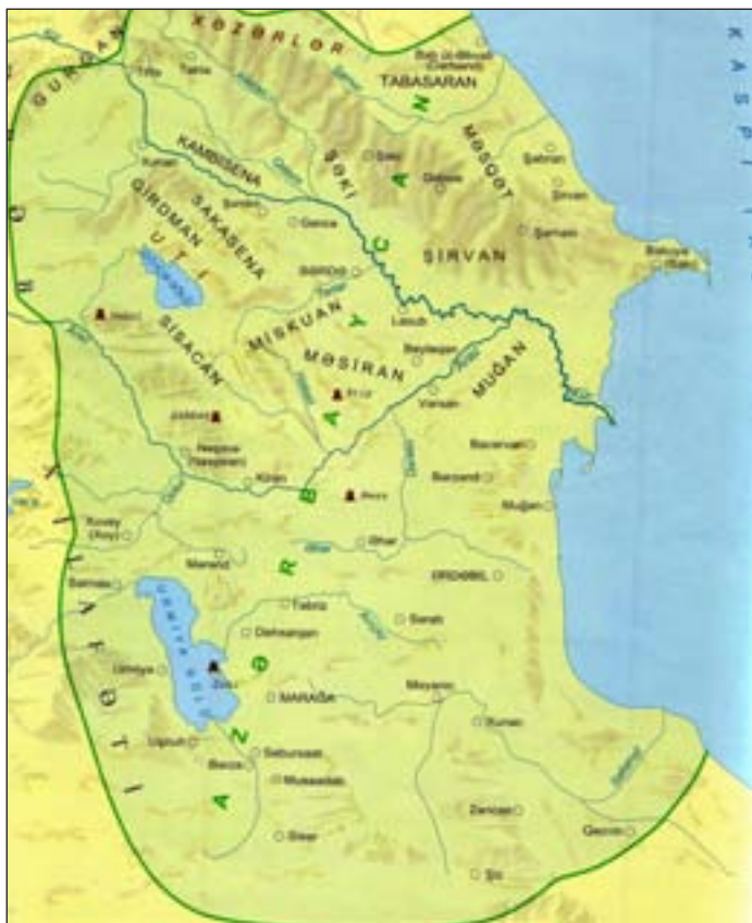
Azerbeidzjan voor de splijting door Rusland en Iran in 1828

De 20e eeuw luidt een radicale verandering in voor het Azerbeidzjaanse volk in sociaal-economisch, politiek en cultureel opzicht.