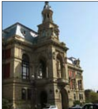
Architectuur in Bakoe