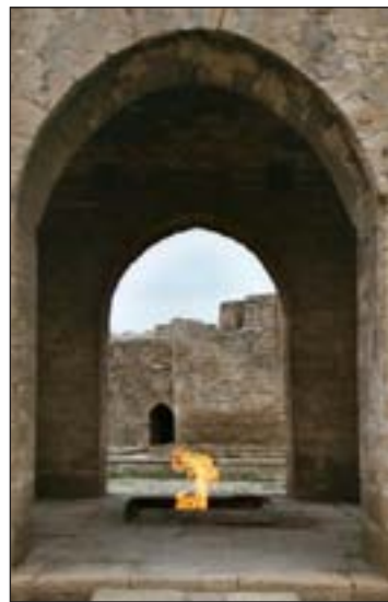
Zoroastrische tempel Bakoe, Azerbaidzjan

Het verspreidingsgebied hiervan valt samen met de vondst van zelfontbrandende bronnen van olie en gas.