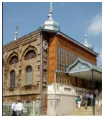
Joodse synagoge in Krasnaya Sloboda, Azerbeidzjan

In 1742 na Chr. krijgen de Joden toestemming