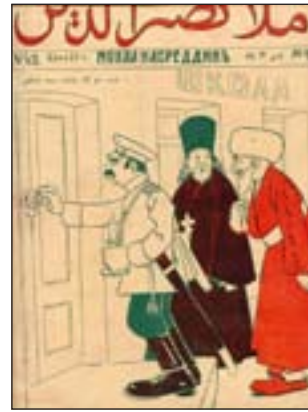
Satirisch tijdschrift Molla Nasreddin

ten in de moedertaal: Hummet, Takammul en kranten in de Russische taal. Er bestaat ook een satirisch tijdschrift: Molla Nasreddin.