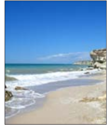
Kustlijn van de Kaspische zee